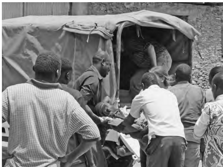
Alle helfen mit, als wir die hochschwangere Frau in unseren Pick-up „verladen“.

Wenn Sie noch erfahren wollen, was es z. B. mit dem „Telephone Hill“ auf sich hat, was ein „Bull Jump“ ist, warum ein katholischer Bischof eine Moschee bauen soll und was die Aktion