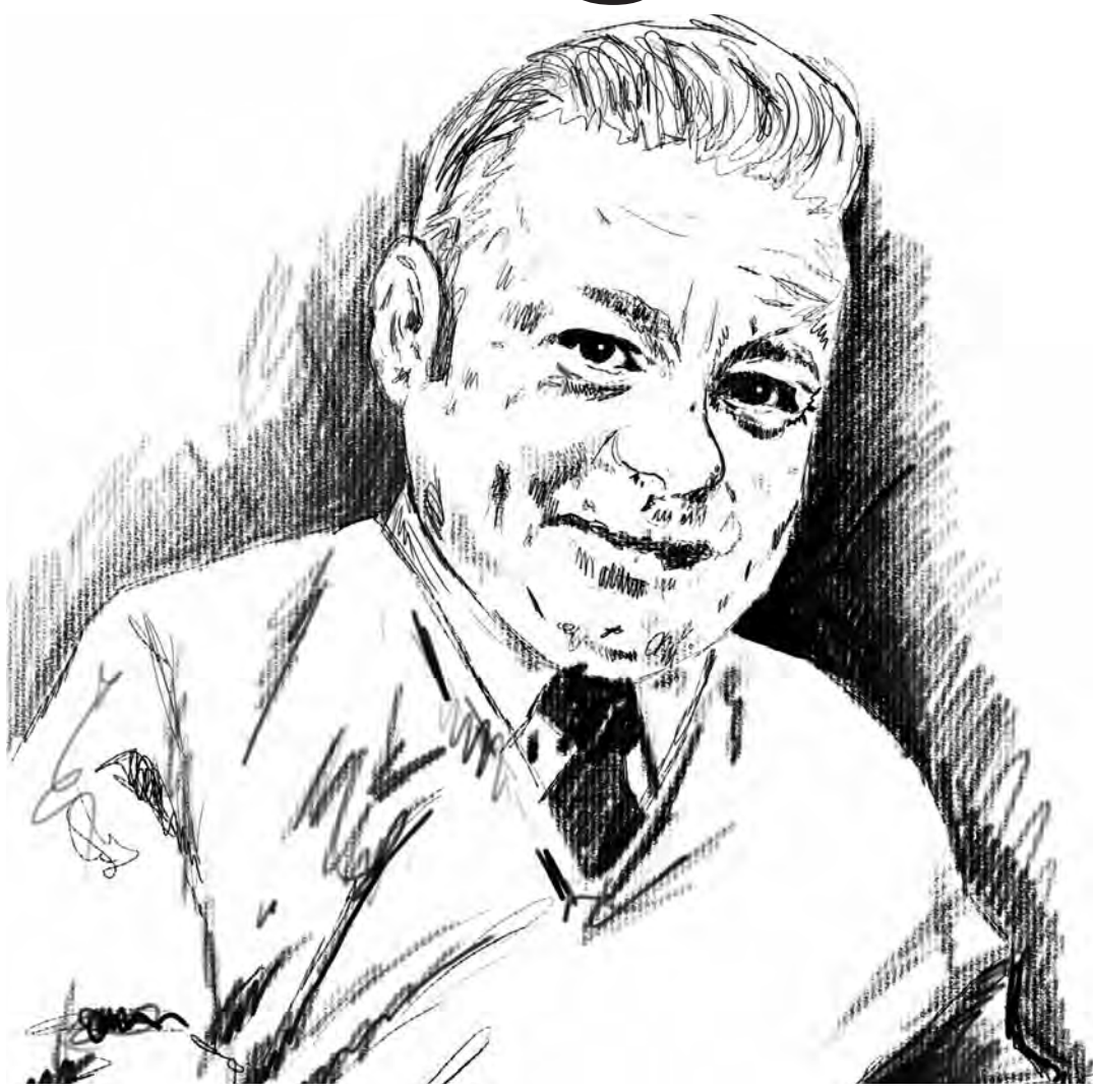
Computermalerei: Zehner, Bochum